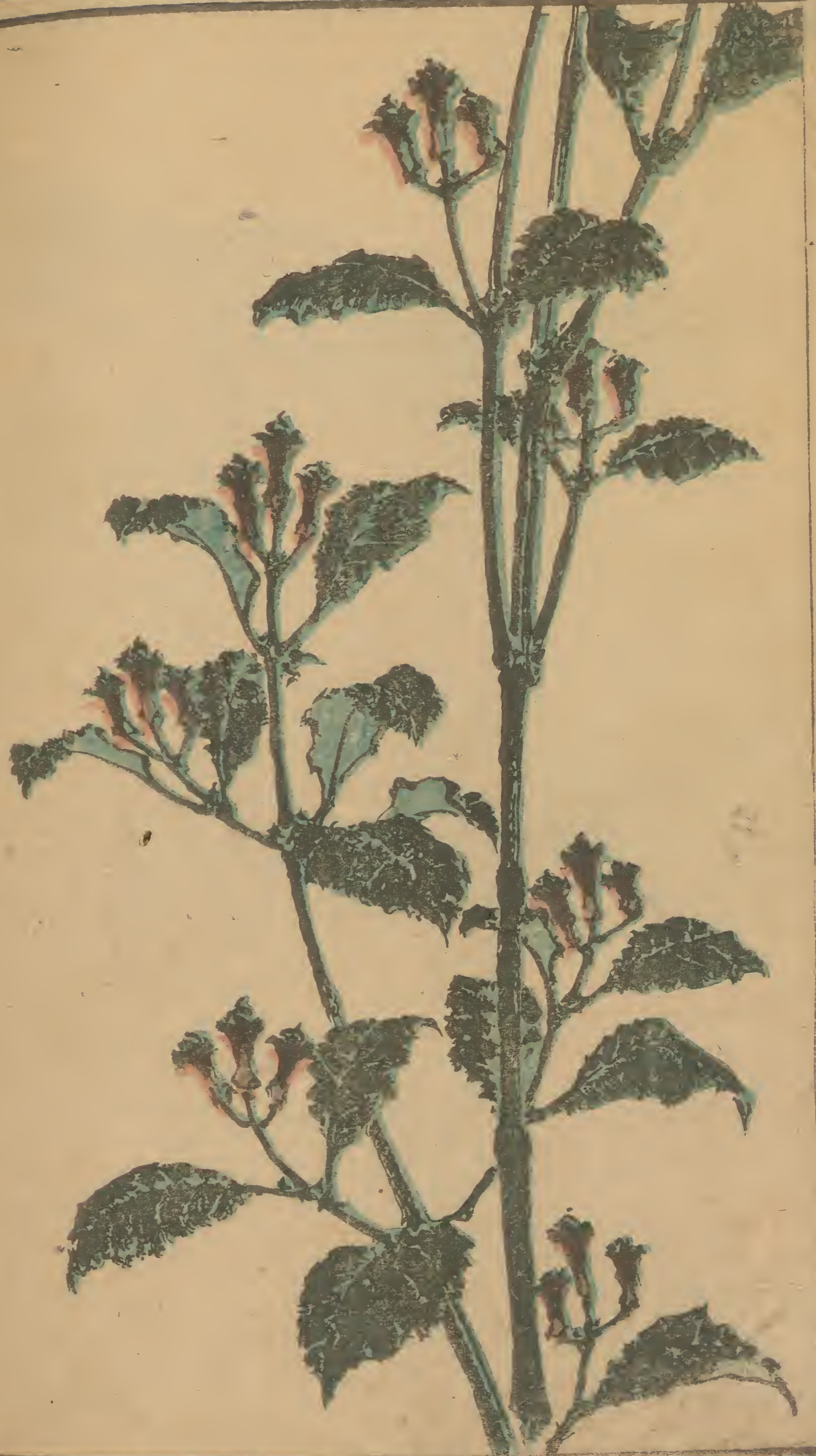
丁香 しょうりょう